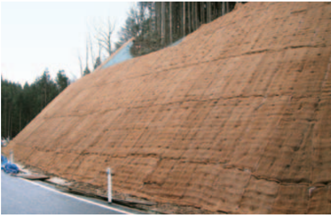
飽海中央地区広域営農団地農道整備事業5工区工事(山形県)