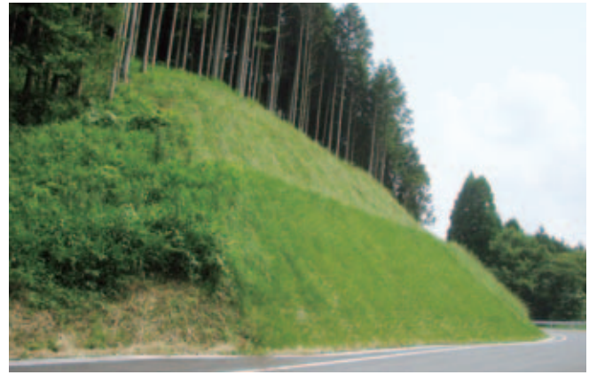
町道大久保米ノ山線第4期改良工事(熊本県)