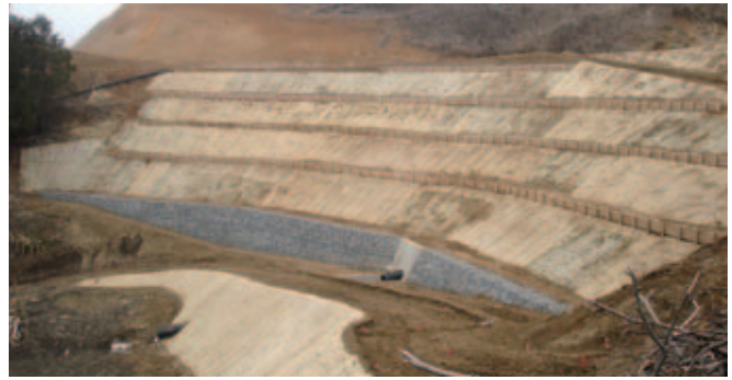
福島県伊達郡川俣町