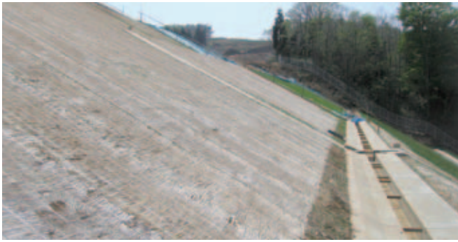
青森県上北郡野辺地町