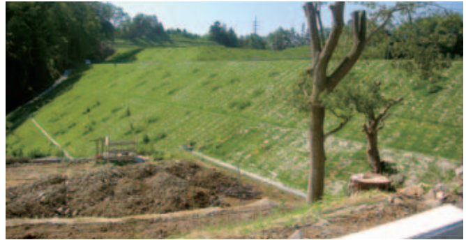
長野県下伊那郡阿南町